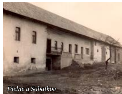
Dielne u Sabatkov