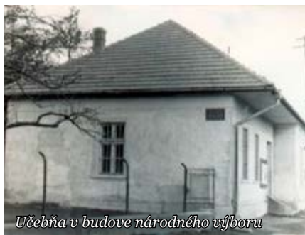
Učebňa v budove národného výboru