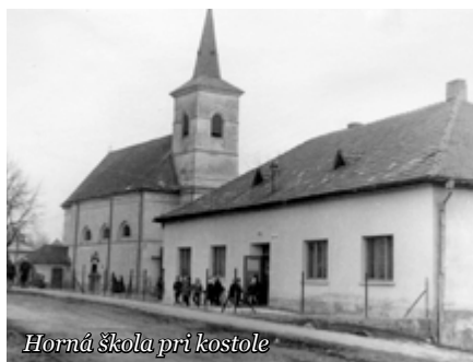
Horná škola pri kostole