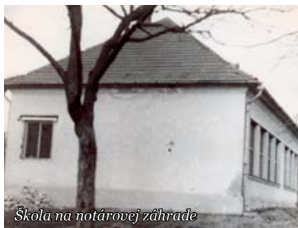
Škola na notárovej záhrade