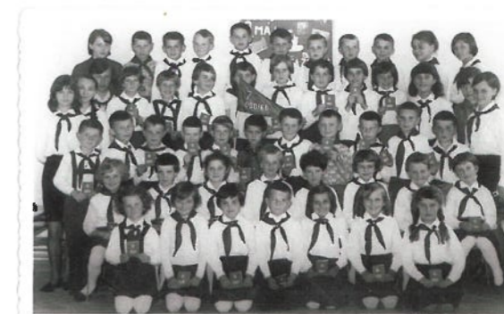
Po pionierskom slúbe