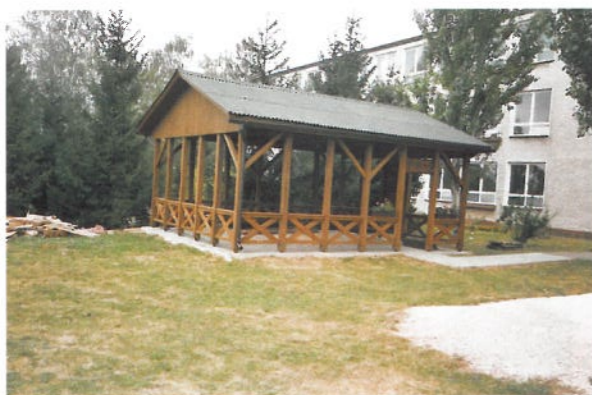
Učebňa v prírode pri základnej škole

2001 sa zamestnanci školy s podporou rodičov rozhodli pre realizáciu náročného projektu. Z prostriedkov regrantikového programu ECHO a vďaka obetavosti rodičov a pracovníkov školy bol altánok - učebňa v prírode slávnostne otvorený v septembri 2004.