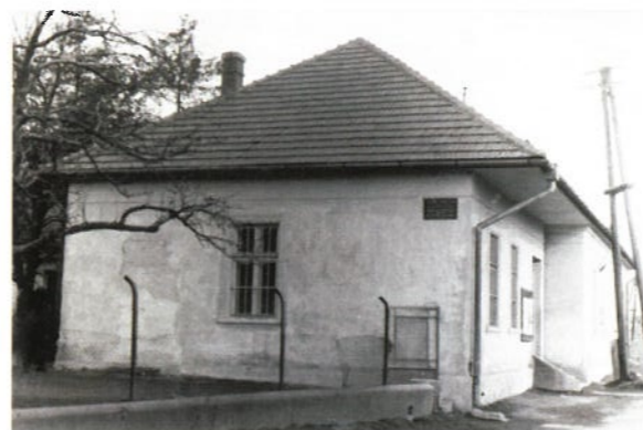
Škola pri hradskej