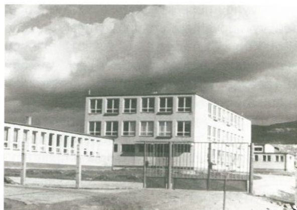
K škole pribudla jedáleň a telocvičňa