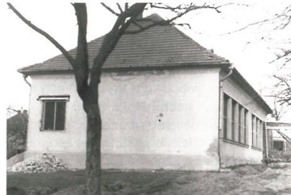
Materská škola I.