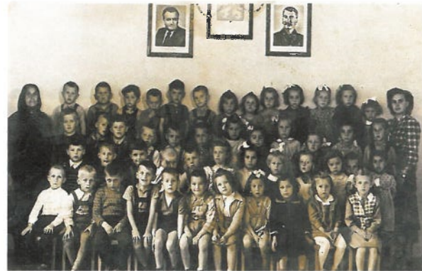
Deti materskej školy v roku 1954