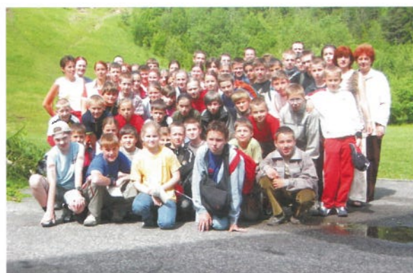
Škola v prírode

Úspešne sa v základnej škole pokračovalo v projekte Infovek, zriadilo sa internetové pripojenie a z nevyužitej triedy vznikla nová učebňa - špecializovaná trieda na vyučovanie informatiky a práce s počítačom. K významným projektom tohto obdobia patrí aj vybudovanie zimného štadióna za budovou školy, klzisko s umelým osvetlením slávnostne otvorili v januári 2004.