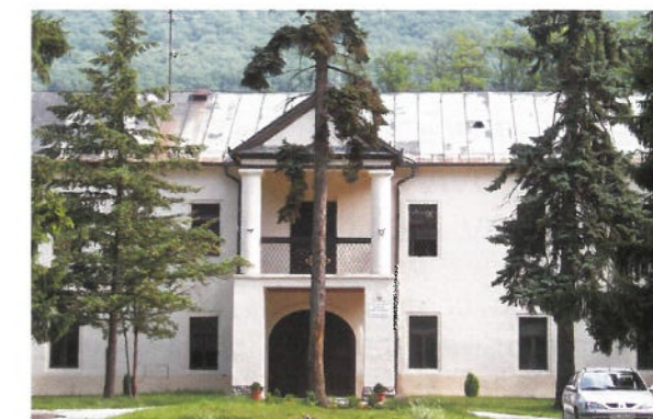
Kaštieľ slúži reedukačnému centru

Reedukačné centrum Bystričany patrí k jednému zo zariadení Krajského školského úradu v Trenčíne a v nepretržitej prevádzke sa v roku 2010 o 44 chlapcov staralo 28 zamestnancov.