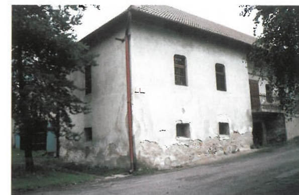
Škola a dielne "u Sabatkov"