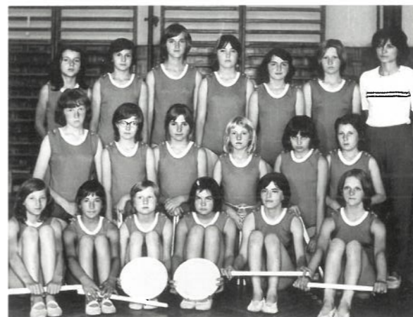
Úspešné gymnastky školy