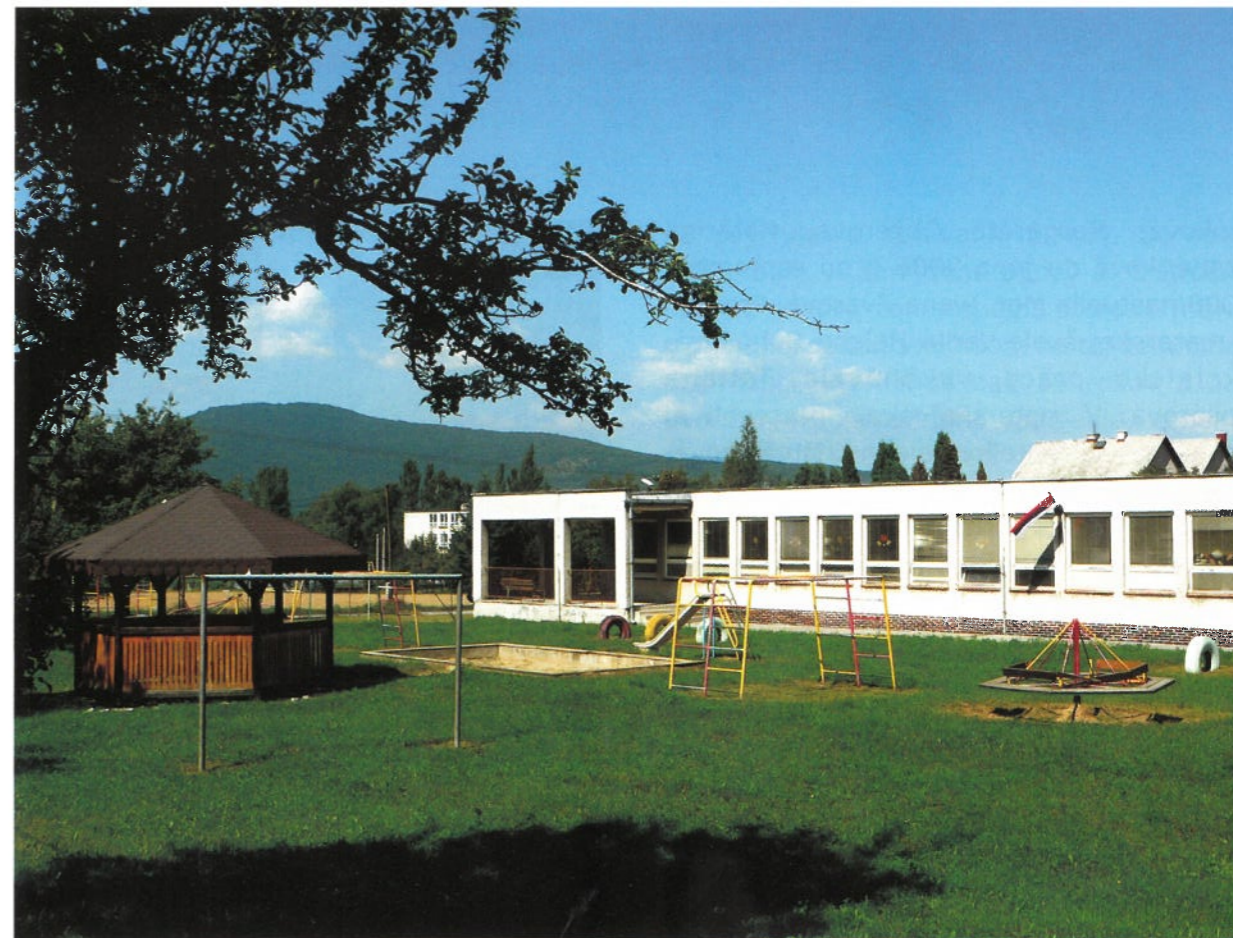
Objekt materskej školy na Vrškoch